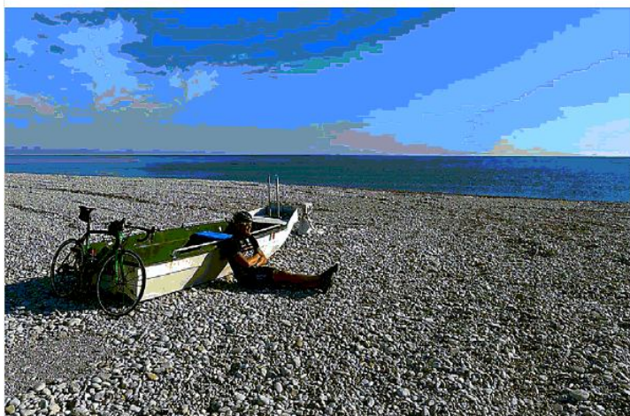
Grand Tours Project

GIRO D'ITALIA LE PROPOSTE DEI TOUR OPERATOR