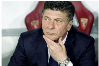
Toscano Walter Mazzari è nato a San Vincenzo (Livorno) il 1° ottobre 1961

La caccia all'Europa comincia in estate. Per il Torino in particolare, perché la prossima stagione vedrà la squadra granata concentrata sull'obiettivo dal primo metro, dal primo giorno. Walter Mazzari è già al lavoro, perché il tecnico del Toro estrae gran parte della sua forza da quella concentrazione totale che lo accompagna ovunque. Ma in questi giorni anche lui deve «arruolarsi» alle vacanze dei suoi campioni, che ritroverà il 6 luglio a Torino per portarli poi a Bormio dall'8 al 22 luglio. In quelle due settimane a quota 1225 metri, ai piedi dello Sclivio, la squadra granata ricomincerà a correre. E incontrerà ogni giorno i tifosi, quelli almeno che avranno deciso di salire in montagna qualche giorno. Il Torino farà allenamento al mattino e al pomeriggio, con almeno una seduta a porte aperte che si concluderà come sempre con una sessione di autografi. L'occasione migliore per stare vicini a Belotti e compagni, per portarsi via un ricordo o un selfie, ma anche per lanciare un'offerta Torino ad alta quota. Il Torino sale a Bormio per il sesto anno consecutivo, ancora al Palace dove stanno verificando i dettagli e la piscinina, dove i giocatori faranno alcuni lavori specifici. Ormai il ritiro non è più quel momento nel quale si corre a lungo e poi ci si allena con la palla tra i piedi. I giocatori tra il 6 e il 7 lavoreranno a Torino. Verifiche mediche e fisiche per tutti, per ca-